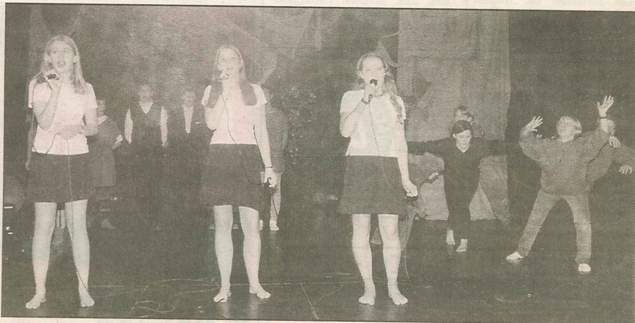
Solister, dansare och kör ingår i det första numret ur filmen Lejonkungen.

De välkända sångerna och melodierna fick den unga publiken att taktfast ackompanjera med hand-