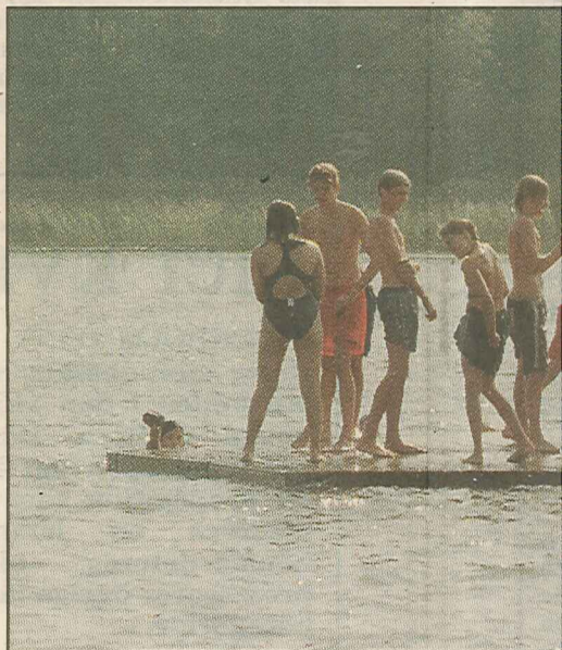
När slotten är färdiga blir det tid över för