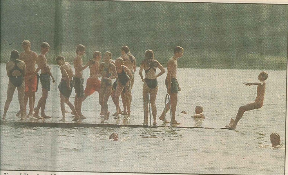
diga blir det tid över för bad.