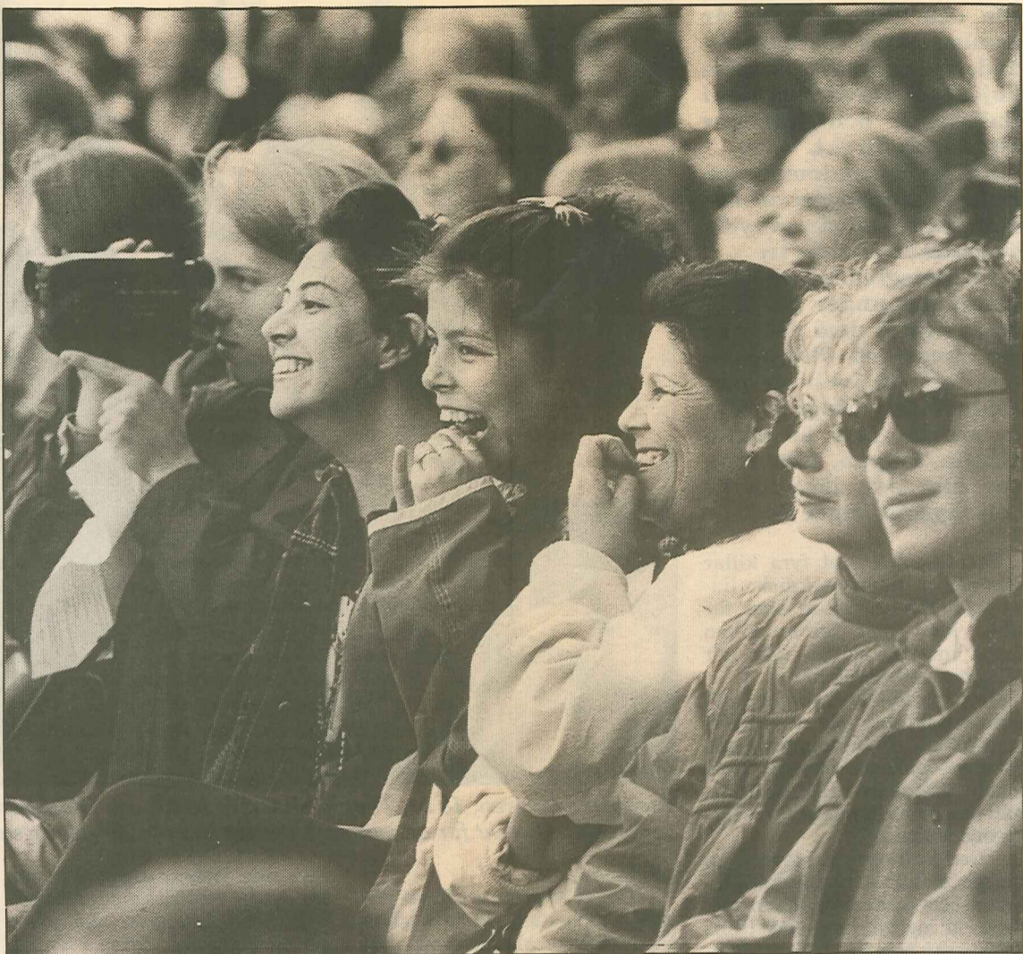
Det var fullsatt på bänkarna och sketcherna fick publiken att kikna av skratt.