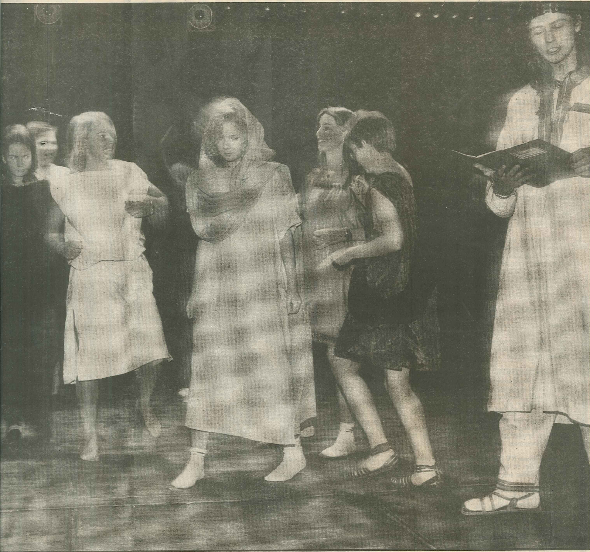
...vunna rubinen är en musikal med mycket sång och dans. "Humor, spänning och kärlek i antikens Rom", står i handsreklamen.